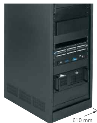
WR-44-32 in geschlossener Position