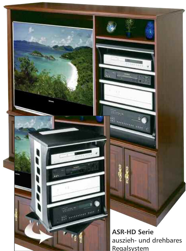
ASR-HD Serie auszieh- und drehbares Regalsystem