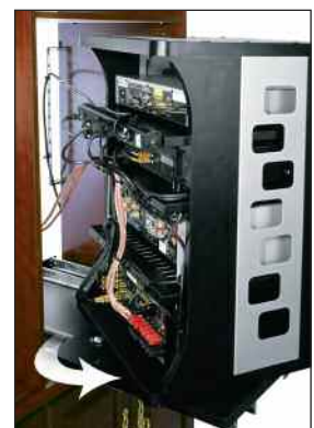
rastet in ausgezogener Position und bei 60° Drehung ein

im Lieferumfang enthaltene Verriegelungsblende sichert das Rack im eingefahrenen Zustand