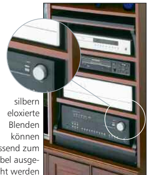
silbern eloxierte Blenden können passend zum Möbel ausgetauscht werden